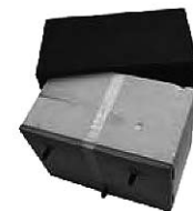
Typ/Type TSB-MB Schall-Isobox/Boîte insonorisante Füllkörper/Remplissage