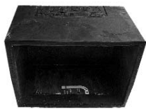
Typ/Type TSB-F Schall-Isobox/Boîte insonorisante