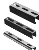
Lochschiene Rails perforés