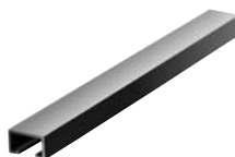
Montageschiene JM Rails de montage JM