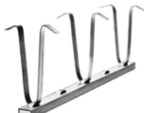
Ankerschiene JSA Rails d'ancrage JSA