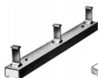
Ankerschiene JTA Rails d'ancrage JTA

Désignation exacte selon ANKABA-Docu (Internet)