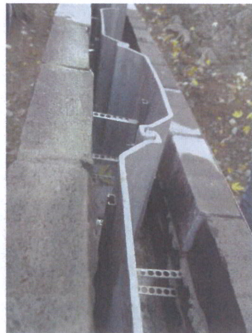
Im PFA 8 wurden die Schienen direkt an den Spundbohlen, zur dauerhaften Befestigung des Basalmauerwerks, befestigt.