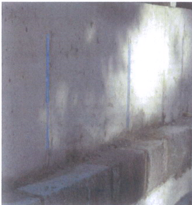
Die Maueranschlussschienen wurden im Abschnitt „Weißer Bogen“ direkt in die Betonwand einbetoniert. Die blaue Schaumfüllung verhindert das Eindringen von Beton.

In Teilbereichen der PFA wurden Stahlbetonwände mit einer Höhe von mehr als zwei Metern ausgeführt und land- als auch wasserseitig mit Naturstein verblendet. Als Material wurde der ortsüblich verwandte und sich gut ins Stadtbild